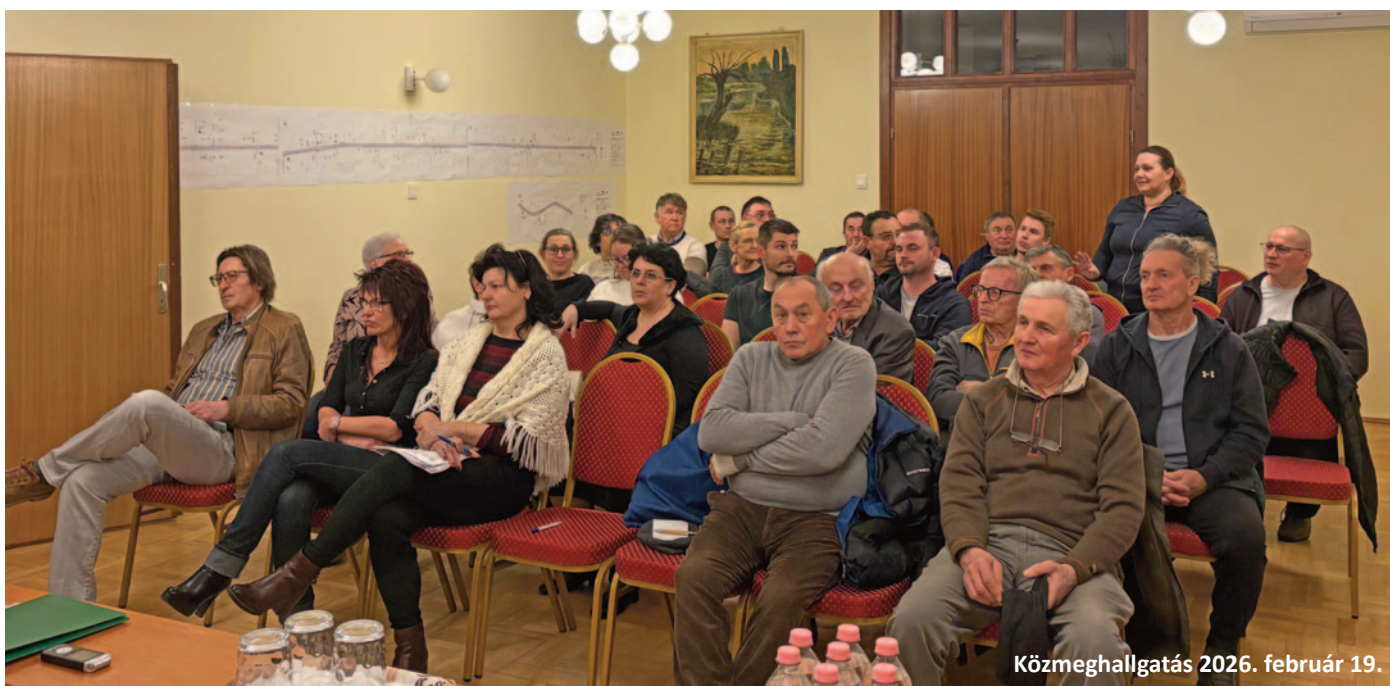
Közmeghallgatás 2026. február 19.